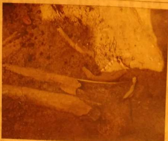
Huesos localizados en una de las tumbas.

Del traslado de la pila, hay testimonio en el Instituto de Patrimonio Cultural Español y parece ser de estilo gótico, con una base octogonal, similar a la de los templos de Orgaz, Sonseca o Gálvez.