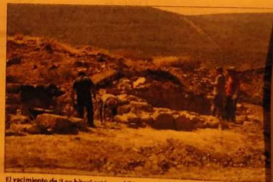
El yacimiento de 'Los hitos' está a un kilómetro de Arisgotas.

Entre las novedades de estos primeros días de excavaciones, figuran la presencia de dos grandes pórticos, al norte y al sur del edificio,