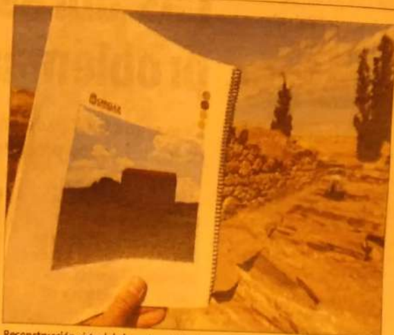
Reconstrucción virtual de las ruinas del palacio visigodo.