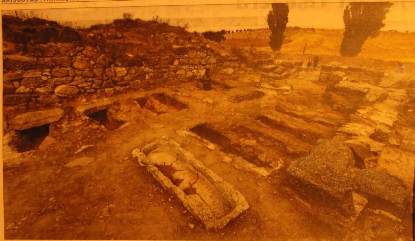
Tumbas localizadas esta campaña en el yacimiento arqueológico de 'Los hitos', en el término de Arisgotas.