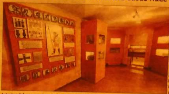
Interior del museo visigodo de Arisgotas.

Arisgotas cuenta con un coque-tito museo dedicado a las piedras de origen visigodo encontradas desde hace décadas por los vecinos en la zona del yacimiento. Los particulares entregaron estas joyas al edificio municipal para mostrar la valía de 'Los hitos', un paraje que descubrió hace ya más de 100 años Simón Martín. Las piedras y las explicaciones del mundo visigodo con-