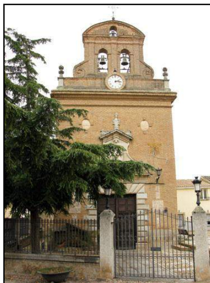
Capilla del Cristo. Nambroca

Falleció a los 77 años el 6 de agosto de 1782, habiendo pasado algunas penurias en sus últimos años según manifiesta en su testamento: " los dilatados males y contratiempos que Dios me ha enviado ". Dejó dicho que se le enterrara con el hábito de San Francisco por ser miembro de su Orden Tercera, y pidió que su féretro lo portaran los obreros de la catedral: " que mediante venir de costumbre que los peones de obra y fábrica de esta Santa Iglesia lleven los cuerpos de los Maestros a la Iglesia y enterrarlos, suplico al Sr. Obrero Mayor mande ejecuten con el mío lo mismo, por haber sido Aparejador de ella "