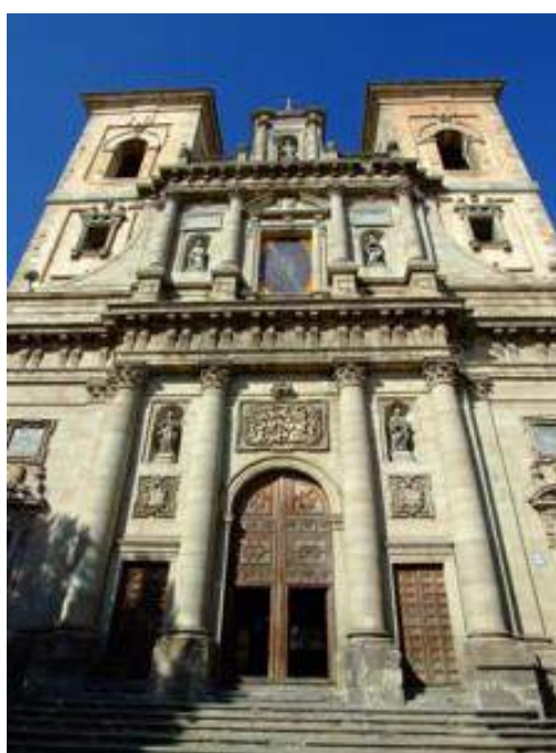
Iglesia de la Compañía de Jesús. Toledo