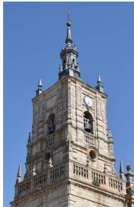
Iglesia de Orgaz