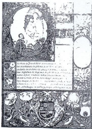
Vigneta de la portada del privilegio concedido a la Villa de Orgaz por el Rey D. Felipe II.